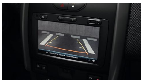
Мультимедийная система Media Nav с сенсорным экраном, навигацией и Bluetooth и камерой заднего вида