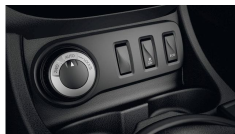
Система постоянного полного привода All-Mode 4x4