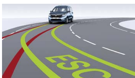
Система курсовой устойчивости ESP