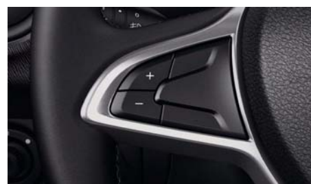
Круиз-контроль (ограничитель скорости)