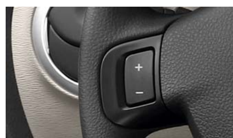
Круиз-контроль (ограничитель скорости)