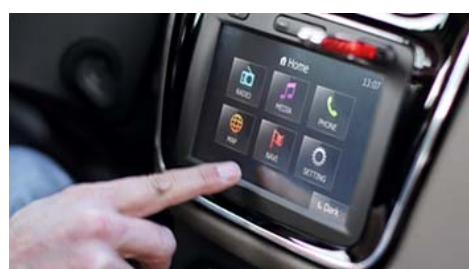
Мультимедийная система Media Nav с сенсорным экраном, навигацией и Bluetooth